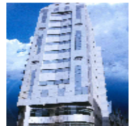
Grand Al Hejra (Makkah)