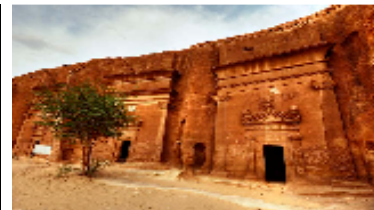
Madain Saleh, Madinah