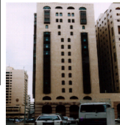
Al Fayroz (Madinah)