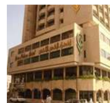
Green Palace (Madinah)