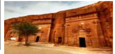
Madain Saleh, Madinah