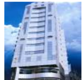
Grand Al Hejra (Makkah)