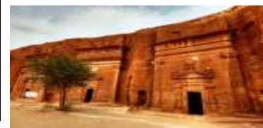
Madain Saleh, Madinah