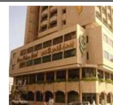
Green Palace (Madinah)