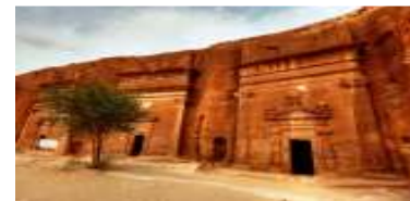
Madain Saleh, Madinah