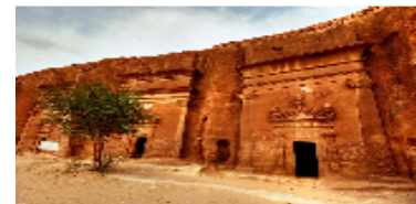
Madain Saleh, Madinah