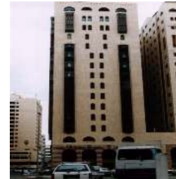
Al Fayroz (Madinah)