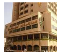
Green Palace (Madinah)