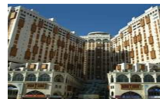
Millennium Towers Apartment