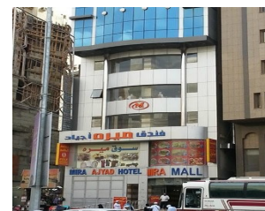
Mira Aiyad Hotel