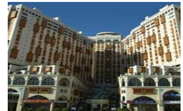
- Makkah Hotel (standard)