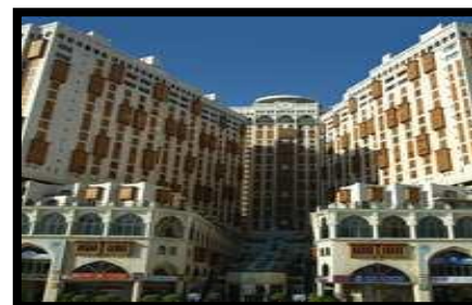
- Makkah Hotel (standard)