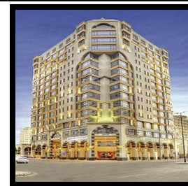
Leader Al Muna Kareem Hotel