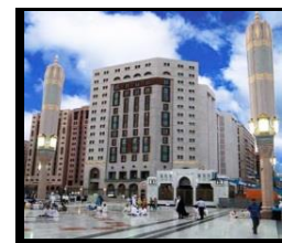
Madinah Oberoi Hotel Upgrade Hotel $700 per adult